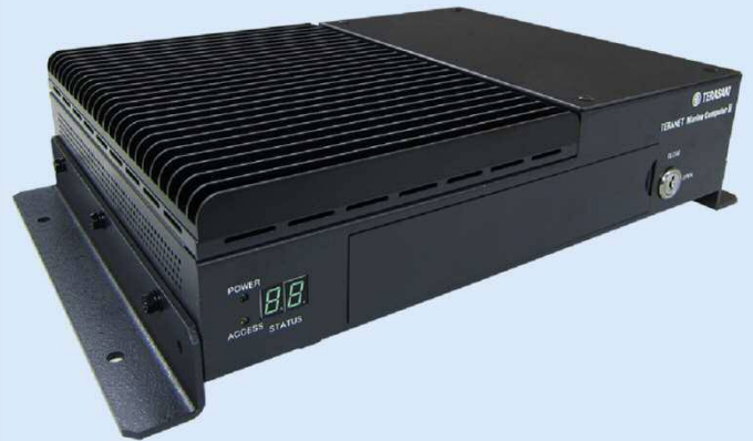
Integrated Control & Monitoring System